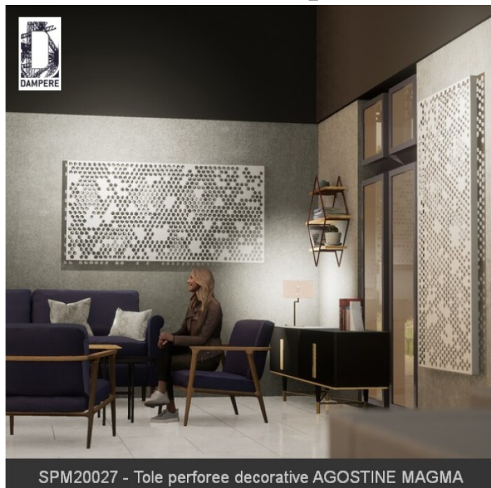
SPM20027 - Tôle perforée décorative AGOSTINE MAGMA