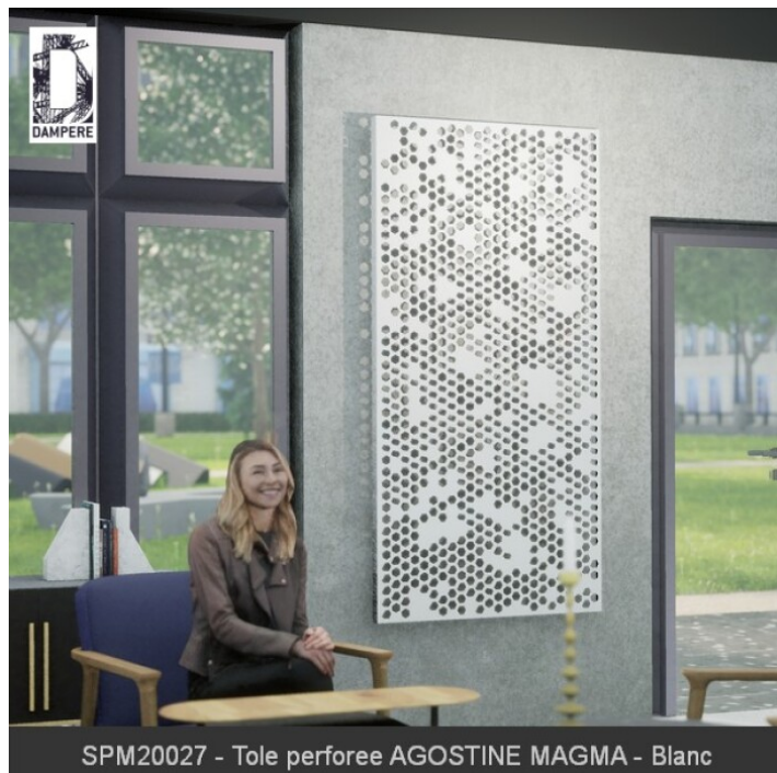
SPM20027 - Tôle perforée AGOSTINE MAGMA - Blanc